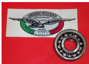
15 x 42 x 13

Roulement Avant d'arbre secondaire Arrière d'arbre primaire