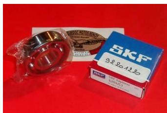
20 x 47 x 14

Roulement Avant d'arbre primaire Arrière d'arbre secondaire